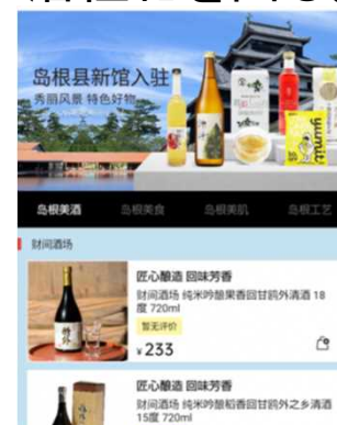
中国向けECサイト豌豆公主「島根館」