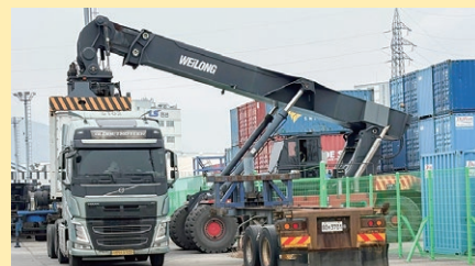
フェリー船腹に積載したコンテナを運び出し、MGシャーシ付車両へ積替えをする様子 ↑