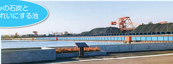
山積みの石炭と排水をきれいにする池