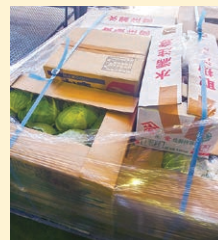
<鮮度保持フィルムで包装されたキャベツ>