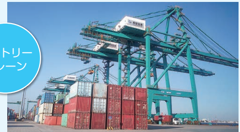
ガントリークレーン